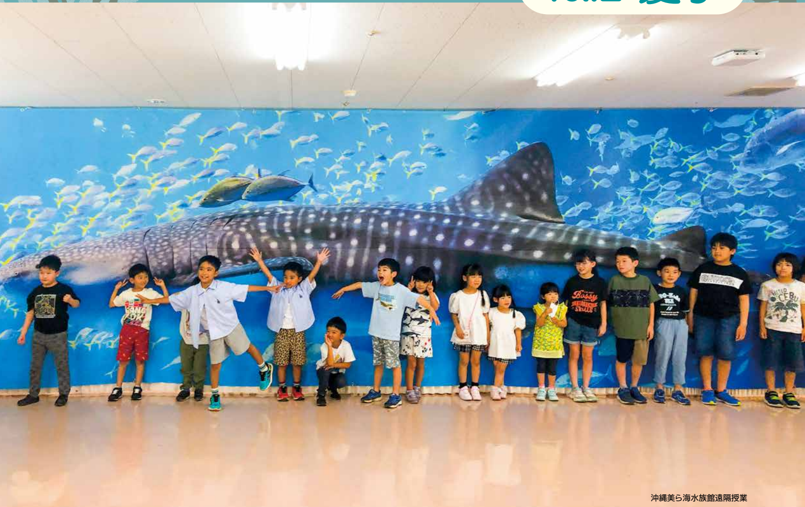
沖縄美ら海水族館遠隔授業